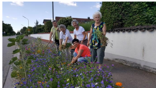
Pflege der Blumenwiesen durch Mitglieder des Gartenbauvereins

Aus meiner Sicht ist dieses Engagement nicht hoch genug zu schätzen, so dass es mir ein Anliegen ist, nicht nur im Rahmen des Neujahrsempfangs, also in kleiner Runde, sondern in diesem Mitteilungsblatt, das an alle Wettstettener und Echenzeller Haushalte verteilt wird, Allen zu danken, die hier einen ehrenamtlichen Beitrag für unser Gemeinwesen leisten.