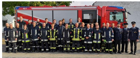
FFW Wettsteten und Echenzell nach erfolgreicher Leistungsprüfung

Ehrenamtliche beim Weißeln der Aussegnungshalle am Friedhof