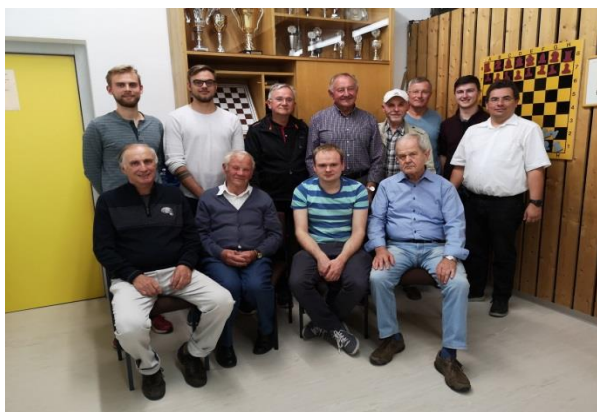
Schachabteilung nach Sanierung des Schachraumbodens

Dies beginnt bei den im Sportverein Tätigen, vom Übungsleiter bis zum Vorstand hin, geht weiter über die in unseren Vereinen Verantwortlichen und sich gemeinnützig engagierenden Vereinsmitglieder, weiter über die die Grünanlagen der Gemeinde pflegenden Bürger in Echenzell und Wettstetten bis hin zum ehrenamtlichen Kulturteam mit den Musikern, und umfasst auch die Elternbeiräte in Kindergärten und Schule, die Gemeinderäte und auch die in den beiden Kirchen sich einbringenden Bürger zusammen mit den Chören und Chorleitern. Dazu gehören aber auch diejenigen, die sich spontan für einzelne Projekte zur Verfügung stellen, um unsere Gemeinde ohne viel Aufhebens schöner zu machen.