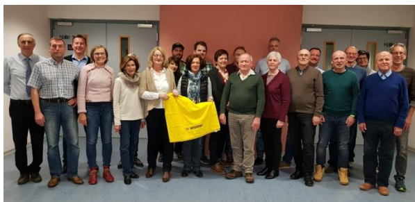
Verdiente Mitglieder und Vorstand des SV Wettstetten

Das Gemeinwesen einer Gemeinde lebt nicht nur von den hauptamtlichen Mitarbeitern, sondern vor allem vom ehrenamtlichen Engagement der Bürger. Auch wenn die Ehrenamtlichen im Rahmen des Neujahrsempfangs eine Wertschätzung erfahren, soll auch in diesem Rahmen auf die vielen Aktivitäten hingewiesen werden, die vielfach unbemerkt von der Bevölkerung zum Gelingen vieler Veranstaltungen, der kulturellen und sportlichen Angebote und dem positiven Erscheinungsbild unserer Gemeinde beitragen.